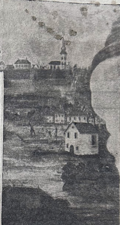
Koprivnička tvrđava iz prve polovine 18. stoljeća (detalj sa oltarne slike sa crkve Sv. Florijana)