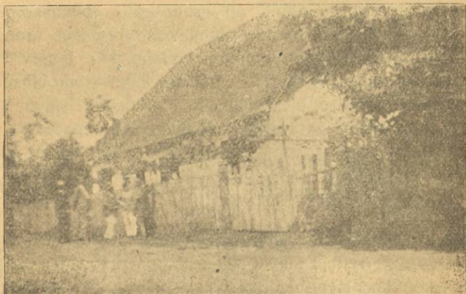
Očinski dom Borojevića u Mečenčanima (S ceste).

Veseli me, što u ime zemaljske vlade prisustvujem ovoj velikoj slavi, ovoj veličanstvenoj svečanosti, da se velikom Hrvatu u njegovoj domaji postavlja ovaj značajni spomenik. Na očinskoj kući neka ova spomenploča bude svjedokom i za potomstvo ovoga velikog rata, u kojem je Borojević skršio neprijatelja svojim junaštvom. Veseli me, što se ova spomenploča otkriva baš danas, kad je upravo junačka naša vojska pod vodstvom velikog lava, odbila neprijatelja od naših granica, te on ubire nove lovorike. Molim, da se ova spomenploča otkrije, te da na očinskoj kući velikoga vojskovođe u dokaz