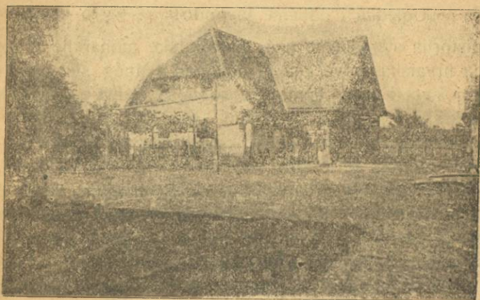
Očinski dom Boroevića u Mečenčanima (S dvorišta).

„Određen sam na čelu deputacije c. i kr. vojske i kr. domobranstva k ovoj plemenitoj, rodoljubnoj svečanosti, da našom prisutnošću dademo vidljivi znak visokog poštovanja prema već historičkoj, cijelom svijetu poznatoj i štovanoj osobi