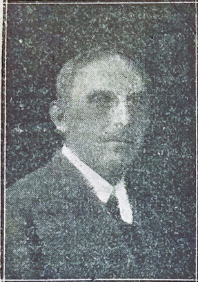
G. dr. Vlatko Maček

Zagreb, 22. prosinca. Na vijesti što dolaze iz Beograda o mogućnosti ostavke vla-